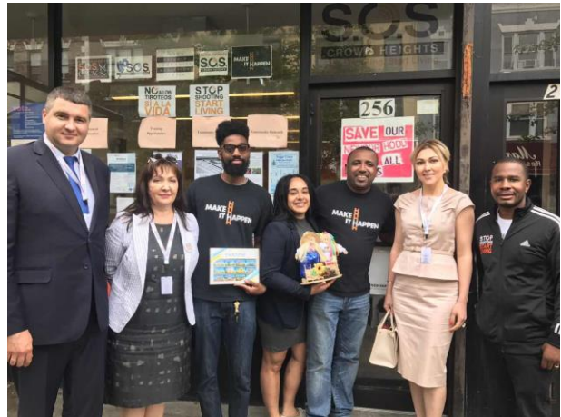
Члени української делегації після зустрічі з Директором, працівниками та волонтерами Громадського центру медіації району Краун Хайтс 16 червня 2017 року в Нью-Йорку.