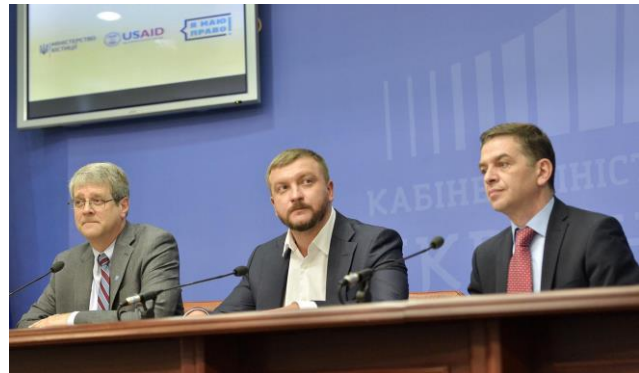
Виконуючий обов'язки Адміністратора USAID Уейд Уоррен, Міністр юстиції Павло Петренко та заступник Міністра юстиції Гія Гецадзе під час прес-брифінгу щодо запуску всеукраїнського просвітницького проекту «Я МАЮ ПРАВО!» 7 червня 2017 року в Києві.

7 червня 2017 року Міністр юстиції Павло Петренко анонсував початок всеукраїнського просвітницького проекту «Я МАЮ ПРАВО!», який впроваджується Міністерством юстиції за підтримки Програми USAID «Нове правосуддя». «Наша мета – сформувати нову правову культуру у суспільстві, що забезпечить сталий розвиток України як сучасної правової демократичної держави. Стратегічним завданням довгострокової національної програми «Я МАЮ ПРАВО!» є підвищення рівня знання українців щодо своїх прав у різних сферах життя», - зазначив очільник Мін'юсту. Виконуючий обов'язки Адміністратора USAID Уейд Уоррен зазначив, що коли люди поінформовані про реформи, коли вони розуміють вигоди від їх проведення і коли бачать, що Уряд поважає права людини, тоді довіра населення до Уряду і судової системи відновлюється. «Тому я сподіваюся, що кампанія «Я МАЮ ПРАВО!» стане зразком якнайкращого інформування про реформи та сприятиме підзвітності уряду перед суспільством», - сказав він. Пріоритетною тематикою інформаційної кампанії на 2017 рік визначено права громадян у сфері доступу до правосуддя, захист прав власності та формування вміння протистояти проявам корупції у вищих навчальних закладах.