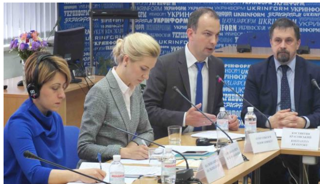
Учасники експертного обговорення щодо створення Вищого антикорупційного суду 16 червня 2017 року в Києві.

16 червня 2017 року Програма USAID «Нове правосуддя» спільно з Координатором проектів ОБСЄ в Україні, Консультативною місією ЄС та Антикорупційною ініціативою ЄС провели експертне обговорення «Вищий антикорупційний суд: кращі практики та перспективи для України», яке стало останнім з серії таких заходів, які відбулися у квітні та травні у Львові, Харкові та Одесі за підтримки програми та Координатора проектів ОБСЄ в Україні. Під час цього заходу судді, експерти, науковці, представники донорських організацій та ЗМІ обговорили світові зразки створення і функціонування антикорупційних судів та статусу їх суддів, причини створення спеціалізованих антикорупційних судів та можливі моделі їх організації, а також стан ініціатив по створенню антикорупційного суду в Україні.