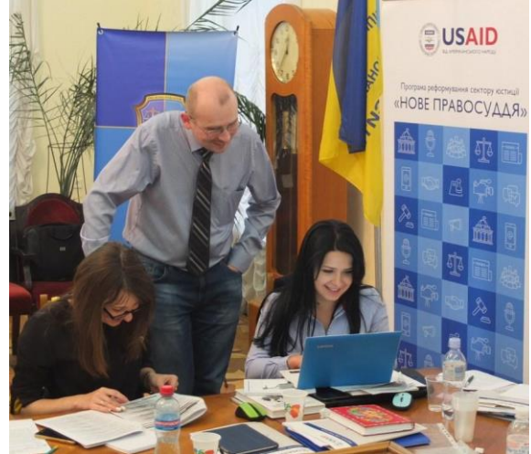
Учасники працюють над розробкою індикаторів для моніторингу юридичних клінік під час практичної сесії 12 травня 2017 року в Дніпрі.

національному університету ім. Олеса Гончара у проведенні практичної секції на тему «Формування стратегічного плану та системи моніторингу дотримання стандартів юридичних клінік» у рамках всеукраїнської науково-практичної конференції «Правоосвітницька діяльність юридичних клінік». Під час заходу експерт програми з юридичної клінічної освіти Ліа Уортхем (США) презентувала результати експертної оцінки проекту стратегічного плану та Стандартів діяльності юридичних клінік в Україні. Члени правління АЮКУ, куратори юридичних клінік з усієї України та викладачі обговорили проект стратегічного плану, розробленого у 2016 році, та внесли зміни до нього відповідно до нових викликів, з якими стикаються юридичні клініки. Учасники також дізналися про Методику зовнішнього незалежного оцінювання процесів забезпечення якості юридичної освіти в Україні , розроблену проектом USAID «Справедливе правосуддя» та програмою USAID «Нове правосуддя», та, спираючись на цю методику, розробили проект інструменту моніторингу юридичних клінік. Результатом проведення практичної сесії стало оновлення стратегічного плану та розробка проекту методології моніторингу дотримання стандартів діяльності юридичних клінік, які АЮКУ використовуватиме спільно з Міністерством освіти та науки, аби забезпечити дотримання стандартів діяльності юридичних клінік.