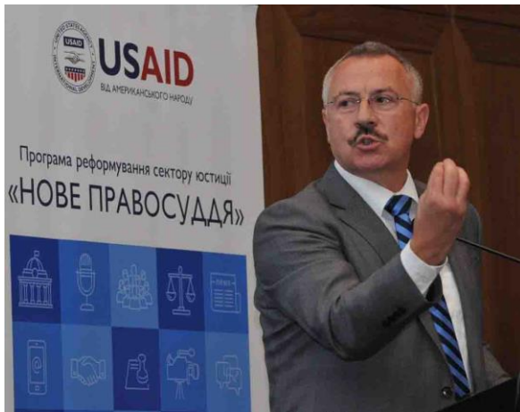
Сергій Головатий, член Венеційської Комісії від України, під час презентації українського перекладу «Rule of Law Checklist» 26 червня 2017 року в Києві.

26 червня 2017 року Програма USAID «Нове правосуддя» спільно з Радою з питань судової реформи та Офісом Ради Європи в Україні провели презентацію документа Європейської комісії за демократію через право (Венеційська Комісія) « Rule of Law Checklist » (« Мірило правовладдя »). Цей документ є інструментом оцінки дотримання принципу верховенства права в державах-членах Ради Європи через аналіз конституційної та нормативно-правової бази, а також судової практики відповідних країн. За підтримки Агентства США з міжнародного розвитку (USAID) Сергій Головатий, член Венеційської Комісії від України, переклав «Rule of Law Checklist» українською та підготував коментар до нього разом із глосарієм (тлумаченням термінів). Ці документи покликані покращити розуміння концепції верховенства права українськими практиками та науковцями й сприяти