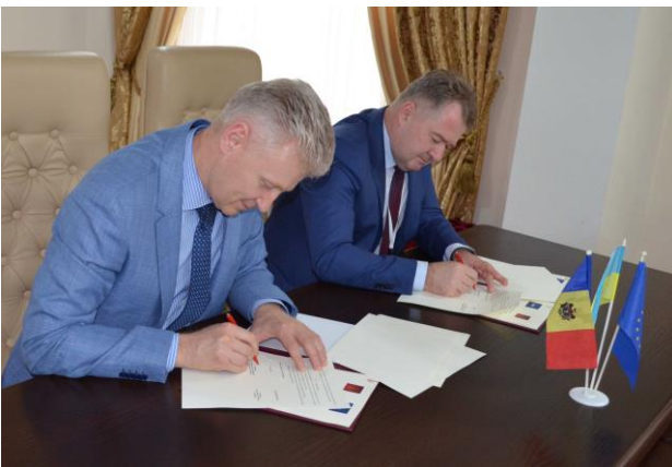
Голова ВРП Ігор Бенедисюк під час підписання Угоди про співпрацю з Головою ВРМ Віктором Міку 6 квітня 2017 року в Кишиневі, Молдова.

3-7 квітня 2017 Програма USAID «Нове правосуддя» підтримала участь представників Вищої ради правосуддя (ВРП) та працівників ІТ-відділів Державної судової адміністрації у навчальній поїздки «Досвід Молдови у запровадженні електронного судочинства» до Кишинєва. Українська делегація відвідала Вищу раду магістратури Молдови (ВРМ), декілька апеляційних судів, Генеральну прокуратуру, Міністерство юстиції та державні організації, які займаються технічною підтримкою судових органів. Учасники дізналися про досвід Молдови у запровадженні електронних рішень у роботі судової системи, зокрема в електронному діловодстві, управлінні якістю роботи судів, статистичній звітності, віддаленому доступі до матеріалів справ та комунікації, а також використання цих систем у реєстрах