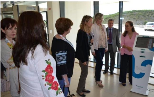
Українська делегація вивчає електронний документообіг в окружному суді міста Сінтра під час навчальної поїздки до Португалії 18 травня 2017 року в Сінтрі.

16-20 травня 2017 року Програма USAID «Нове правосуддя» провела навчальну поїздку до Вищої ради судівництва Португалії (Conselho Superior da Magistratura – CSM) у Лісабоні для членів Вищої ради правосуддя (ВРП) та представника секретаріату ВРП. Навчальна поїздка зосереджувалася на вивченні досвіду та діяльності CSM, зокрема статусі та повноваженнях CSM у сфері стратегічного планування, організації документообігу, дисциплінарному провадженні стосовно суддів та ролі CSM у захисті суддівської незалежності й наданні висновків щодо законопроектів, які стосуються судової влади. Учасники також відвідали окружний суд міста Сінтра, де голова суду